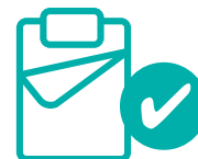
BEDDENGOED LAKENS & DEKENS